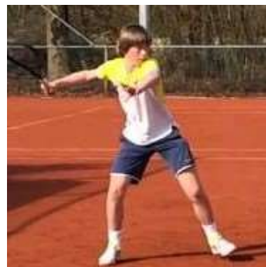
Under16 from Netherlands

主催 有限会社ジャパンテニスプレーヤーズプロダクション 国際選手活動サポートセンター 共催 GRAN 日程 2021年11月6日(土)・7日(日) 締切日11月3日(水・祝) 会場 北海道・札幌市 : 札幌市平岸庭球場 〒062-0935 札幌市豊平区平岸5条19丁目2-1 定員 男子シングルス : 48名 / 女子シングルス : 48名 エントリー料 ¥4,200 ※大会当日会場にてお支払いください サーフェイス ハードコート / デコターフ 種目 17歳以下男子シングルス / 17歳以下女子シングルス ※2004年1月1日以降出生の選手