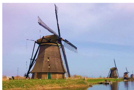
Mill Network at Kinderdijk-Elshout